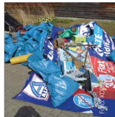
gesammelte Müllberge 2017

fruehjahrsputz_in_moisling@yahoo.de oder im Soziale-Stadt-Büro. KDD