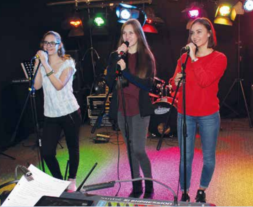
Sängerinnen bei den Eurokidz