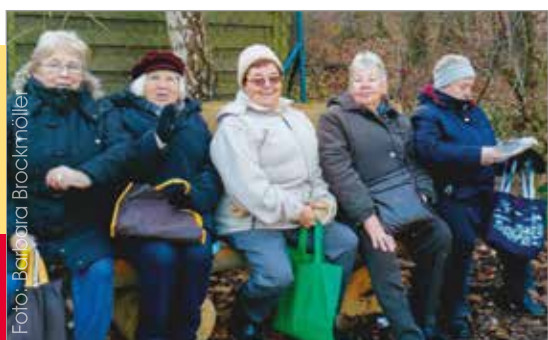
Die Wandergruppe macht Pause

Mach mit – Halt dich fit! Unter diesem Motto spielt die gemischte Mannschaft von Rot-Weiß Moisling Prellball. Diese Sportart ist ähnlich wie Tennis. Der Ball wird über ein kniehohes Netz in das gegnerische Feld gespielt. Die Mannschaft spielt jeden Freitag von 18-19.30 Uhr in der kleinen Sporthalle der Heinrich-Mann-Schule. Wer Lust hat mitzuspielen: Am besten vorbeikommen und gleich mitspielen – Turnschuhe nicht vergessen. (AK)