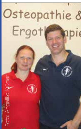
Das Team von Hofmann & Hachmann

Lernen, sich rückenfreundlich im Alltag zu verhalten und zu bewegen ist das Ziel der Rückenschule, die die Physiotherapiepraxis Hofmann & Hachmann im Gesundheitszentrum anbietet. Weitere Informationen bei Physiotherapie Hofmann & Hachmann, Tel: 0451 - 29 220 420, E-Mail: hofmannhachmann@gmx.de (AK)