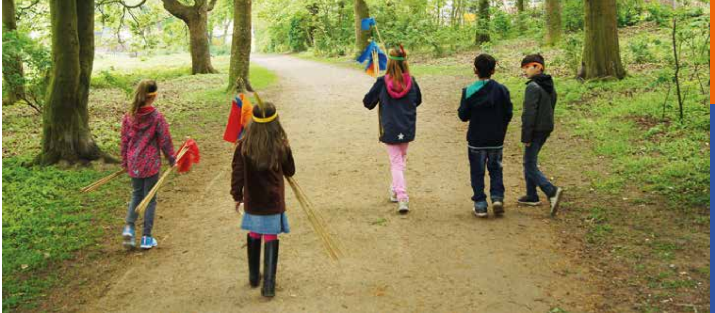
Kinder auf dem Weg zur Indianerrallye