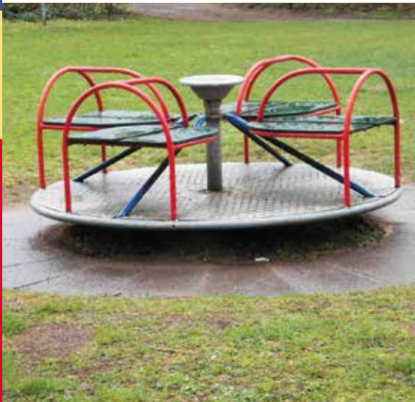
Karussell auf dem Spielplatz Kuppe

In der Ausgabe 3/ 2017 von moisling aktuell berichteten wir über das Konzept für Moislings Grün. Nun wurde das Konzept fertig gestellt und in der Beiratsitzung im Oktober 2017 vorgestellt. Die Umsetzung soll in diesem Jahr mit der Umgestaltung und Aufwertung des Grünzugs „Auf der Kuppe“ beginnen. Drei Landschaftsarchitekturbüros erstellen derzeit hierfür Entwürfe. Der beste Entwurf wird ausgewählt und geht dann in die Planung. Uta Behrend von der Familienkiste beteiligt sich als Vertreterin des Beirats am Auswahlprozess der Entwürfe. Kinder und Jugendliche werden bei der weiteren Planung einbezogen.