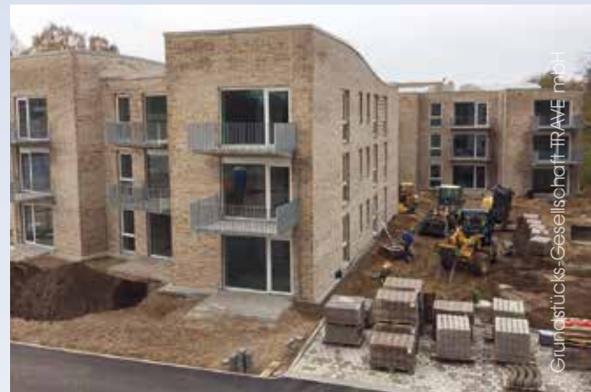
Baugeschehen am Schneewittchenweg

Melanie Loebe, Grundstücks-Gesellschaft TRAVE mbH