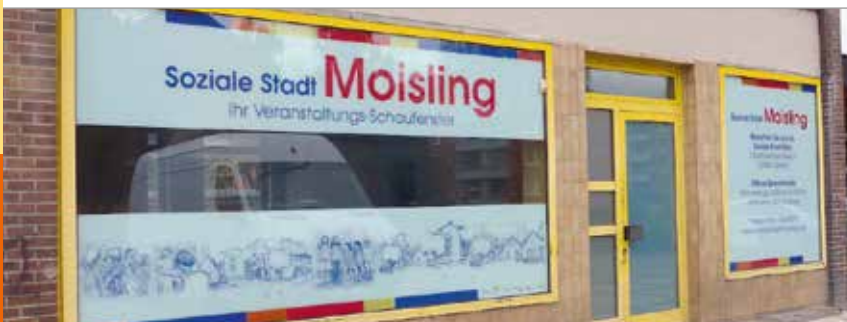
Stadtteilschaufenster im Moislinger Mühlenweg

Das Stadtteilschaufenster im Moislinger Mühlenweg 62 kann von allen Einrichtungen im Stadtteil genutzt werden, um auf ihre Angebote aufmerksam zu machen. Plakate und Flyer können im Fenster des von der Grundstücks-Gesellschaft TRAVE zur Verfügung gestellten Ladens ausgehängt werden. Den Schlüssel für das Stadtteilschaufenster gibt es im Soziale-Stadt-Büro.