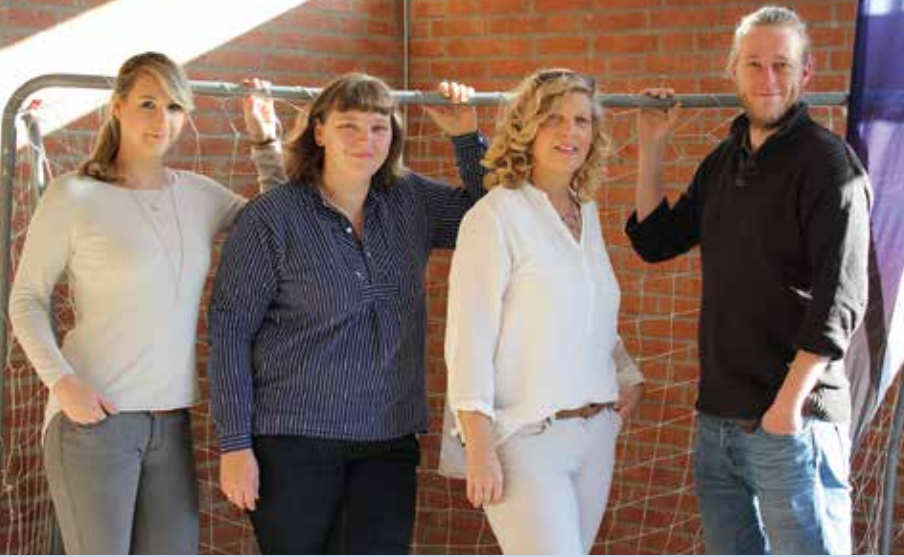
Das neue Team vom Freizeitzentrum