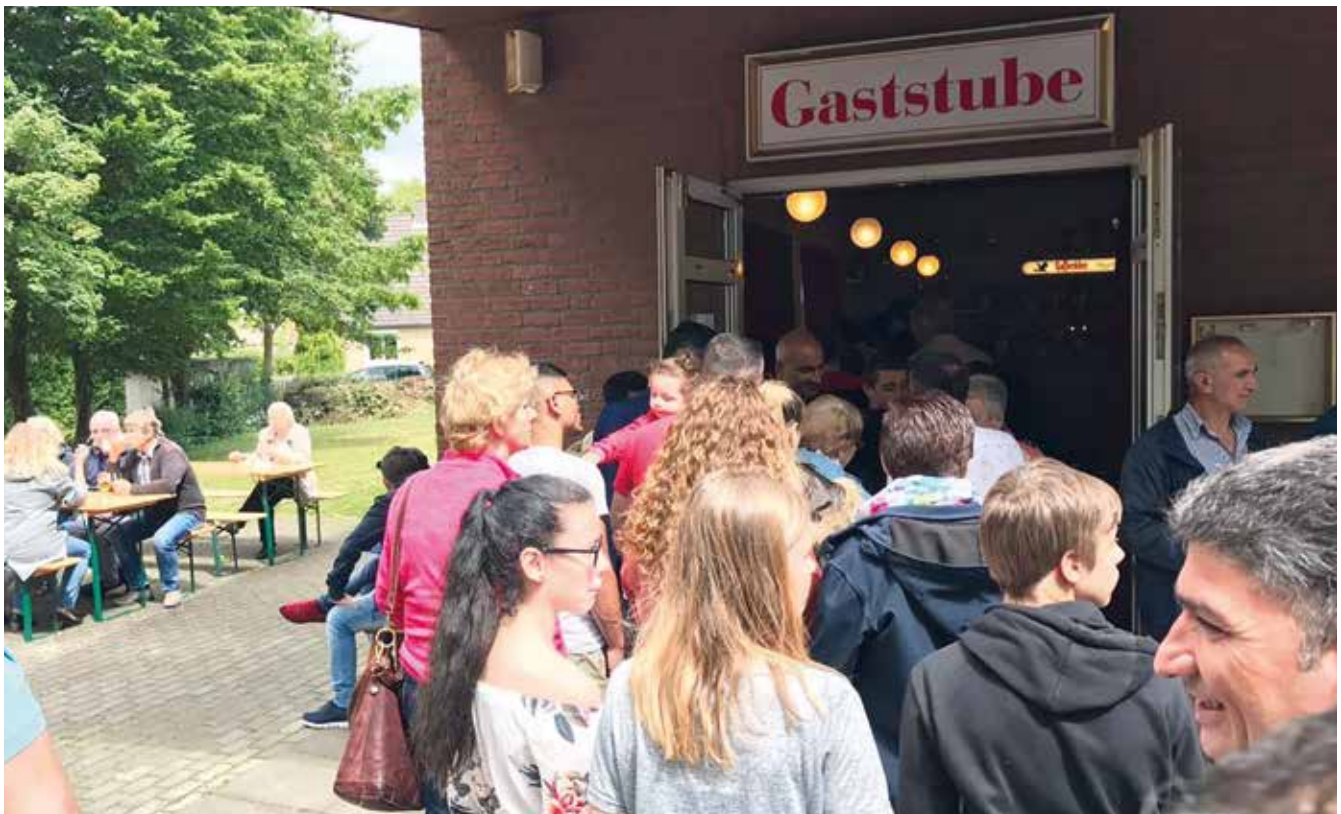
TeilnehmerInnen beim interkulturellen Sommerfest