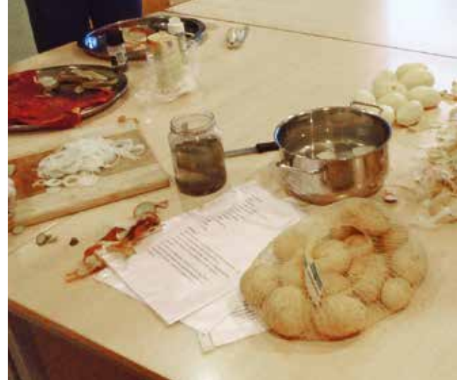
Ausstattung für gemeinsames Kochen

ein/e konkrete/r Ansprechpartner/in benannt wird. Sie brauchen Unterstützung? Wir im Soziale-Stadt-Büro helfen gern bei der Antragstellung! 2017 standen dem Stadtteil 15.000,- Euro zur Verfügung. Das Geld wurde nahezu vollständig ausgeschöpft und viele Projekte sind gelaufen.