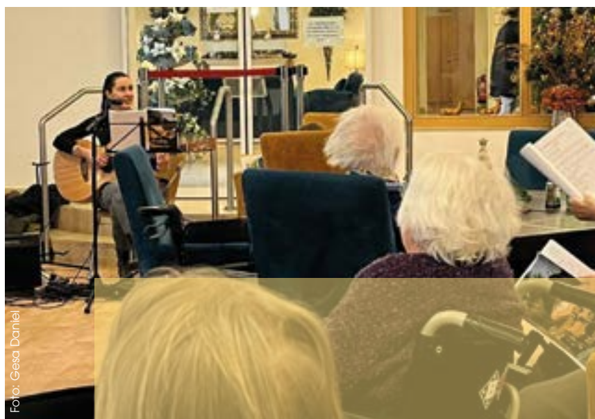
Mit Gitarre und Verstärker erklingen alte Schlager im Seniorenhaus Hinrichsa