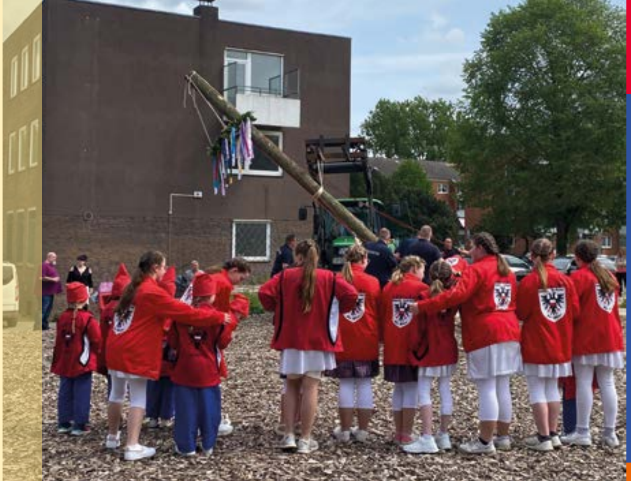
Die Kindertanzgruppe von Rut-Wiess schaut beim Aufstellen des Maibaums zu.

Als weiteren Höhepunkt stellte die Lübsche Karnevals-Gesellschaft "Rut-Wiess" von 1951 e.V. mit Unterstützung der Freiwilligen Feuerwehr Moisling den ersten Moislinger Maibaum auf. Gemeinsam wurde der Maikranz mit bunten Bändern geschmückt und der Baum an langen Seilen in die Verankerung gehoben. Zum Schluss tanzten kleine rotbemützte Zwerge von der Rut-Wiess Kindergruppe um den Maibaum.