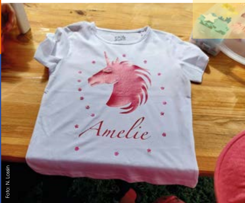
Ein selbst gestaltetes T-Shirt von Amelie

„Bunt, friedlich und lebendig“ feierten die Teilnehmenden ihre Nachbarschaft bei strahlendem Sonnenschein. Durch die Förderung des Verfügungsfonds konnte das Stadtteilfest mit bunten Plakaten und Postkarten in Moisling beworben werden.