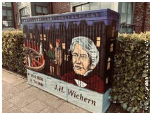
Stromkasten in Gedenken an Johann Hinrich Wichern.

Angelehnt an die bunten Stromkästen in Moisling, welche mithilfe des Anti-graffiti-Vereins Lübeck e.V. (AGIL) seit 2020 verschönert wurden, zieht nun ein weiterer Stromkasten gegenüber der Wichern-Kirche die Blicke auf sich. Das Kunstwerk erinnert an den Theologen und Pädagogen Johann Hinrich Wichern, dem die Wichern-Kirchengemeinde ihren Namen zu verdanken hat. Unter anderem ist Wichern für die Erfindung des Adventskranzes bekannt, der ebenfalls auf dem Stromkasten verewigt wurde.