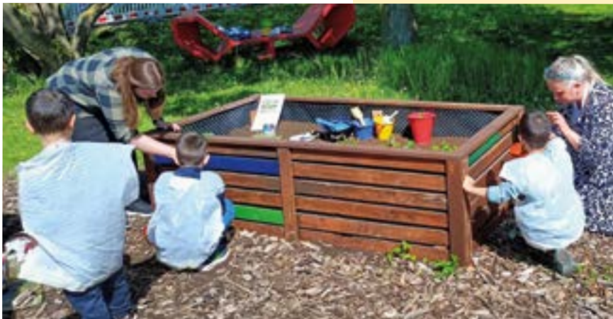
Die bemalten Hochbeete laden zum Gärtnern ein

grün. Außerdem bepflanzten die jungen Gärtner:innen die neuen, bunten Hochbeete mit Erdbeerpflanzen. Nachdem die Kinder erste Erfahrungen mit dem Gärtnern sammelten, übernehmen sie in Zukunft gemeinsam mit der Familien-Kiste als Beetpat:innen die Bewässerung.