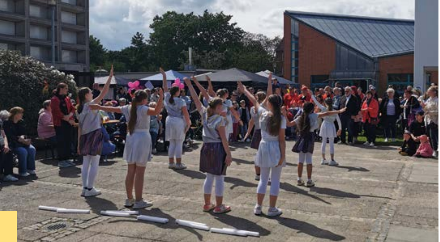
Tanzaufführung auf den Kirchvorplatz