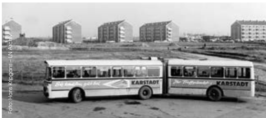
Blick auf Moising im Jahr 1965

Der bis dahin dörflich geprägte Stadtteil Moising hatte sich durch die damalige Straßenbahnlinie 2, die kulturellen Angebote (Kaffeehäuser, eine Flussbadeanstalt, die „Filmbühne Moising“) und der vielfältige Natur zum Bau einer neuen Großwohnsiedlung angeboten. Das Auto und entsprechend breite Straßen rückten zu dieser Zeit ins Zentrum der Planungen, sodass breite Straßen