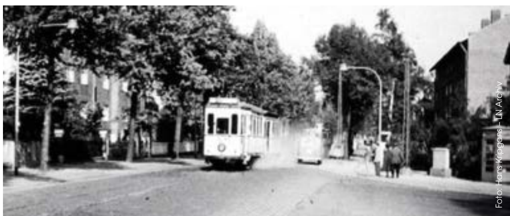
Ansicht der Straßenbahn 1955

Durch den Bauboom brauchte die ganze Stadt schnell viele Straßennamen, sodass das Tiefbauamt der Hansestadt vorschlug, die Hauptstraßen Moislings nach Märchendichtern, bzw. -sammlern und die Nebenstraßen nach ihren Figuren zu benennen. So war der schnelle Bau der Siedlung für viele Menschen eine „märchenhafte“ Entlastung in Zeiten der Wohnungsnot und die sogenannte Märchensiedlung kam mit Straßen wie „Sterntalerweg“, „Heinzelmännchengasse“ und „Knusperhäuschen“ nach Moising. (Andrea Bohacz)