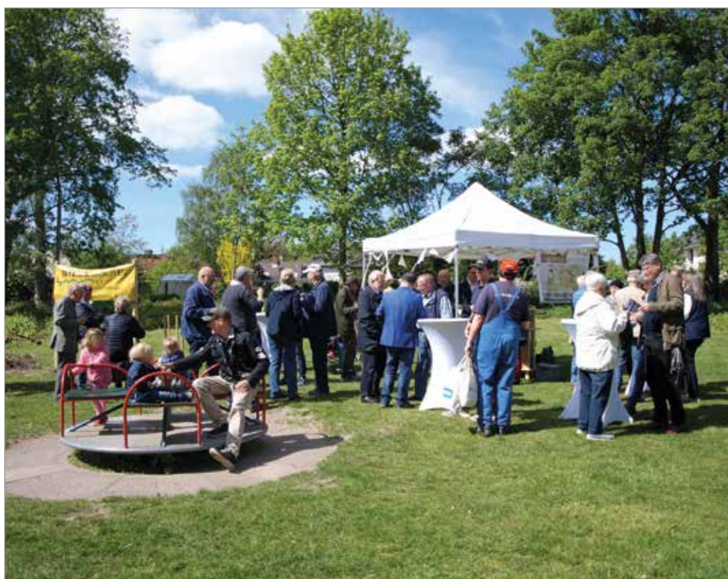
Reichlich Gäste beim Spatenstich

ländliche Räume und Integration in Kiel die Umgestaltung fördert. Die Fördermittel in Höhe von 590.000 € werden zu gleichen Teilen von Bund, Land und der Hansestadt Lübeck getragen. Senatorin Hagen war stolz, dass sich Moising mit dem Spatenstich zu einem tollen großen Projekt am bundesweiten „Tag der Städtebauförderung“ beteiligte und zeitgleich mit anderen Kommunen und Städten auf Veränderungen in der Stadt aufmerksam machte. Bürgermeister, Senatorin und MoisingerInnen kamen zu Gesprächen an der neuen mobilen Bar zusammen, die Kinder und Jugendliche des Freizeitzentrums gebaut hatten. Es gab leckeren regionalen Apfelsaft vom Musterbiotop am Moisinger Baum und viele Informationen zum geplanten Bauablauf.