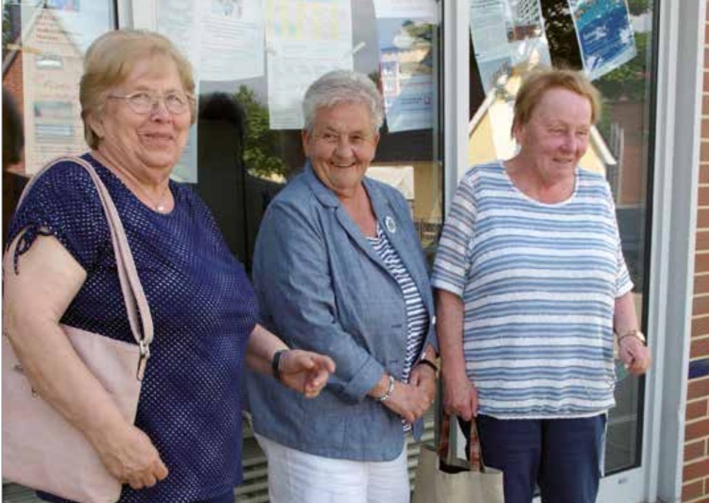
Die Geburtstags- frauen