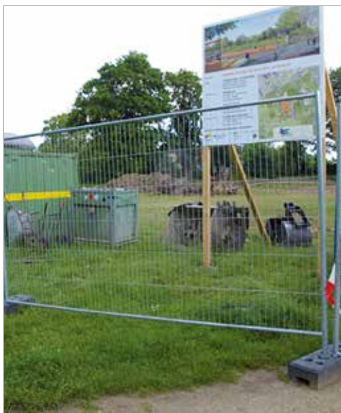
Das Baustellenschild „Auf der Kuppe“

Inzwischen sehen wir schon erste Veränderungen. Die Bagger rollen und ein Bauzaun wurde aufgestellt, so dass große Teile der Wiese und einzelne Wege gerade nicht genutzt werden können. Das ist im Moment schade – aber am Ende wird es um so schöner. Was sind jetzt die ersten Bauschritte? Zunächst müssen große Mengen Boden ausgehoben werden, um die Spielflächen für den Kleinkindbereich, die später mit Sand gefüllt werden, vorzubereiten. Auch muss die Anhöhe befestigt werden, auf der eine Schaukel stehen soll. Später werden der Boden für das neue Ballspielfeld verdichtet und die Geräte aufgestellt. Wer neugierig ist, wie der Bau des Spielplatzes voran geht, kann sich an einer Baustellenführung beteiligen. Achten Sie auf unsere Aushänge in den Schaufenstern. Wir laden Sie dazu herzlich ein.